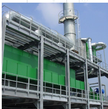
Installation adsorption sur charbon actif