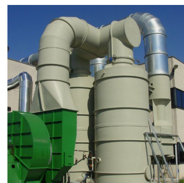
Laveurs de gaz