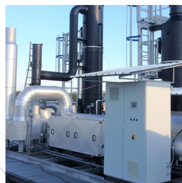
Installations DeNOx SCR