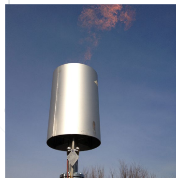
Torches à la flamme ouverte ou fermées