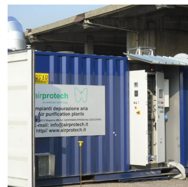
Systèmes mobiles épuration gaz